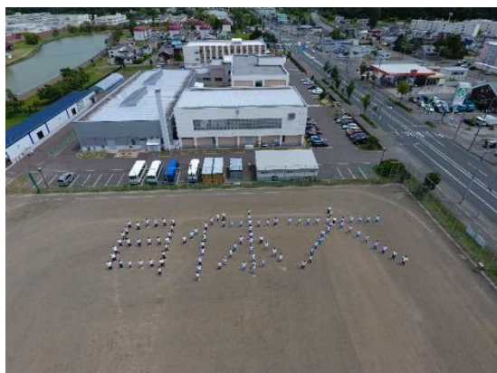
全校生徒（71名）教職員（29）の見事な人文字「日体大」が完成！